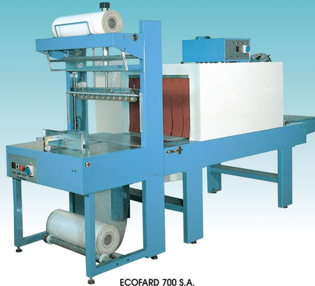
ECOFARD 700 S.A.