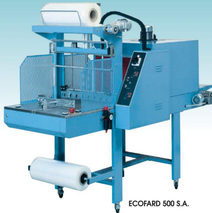
ECOFARD 500 S.A.

AFFARDELLATRICI AUTOMATICHE & SEMIAUTOMATICHE AUTOMATIC & SEMI-AUTOMATIC SLEEVE PACKAGING MACHINES