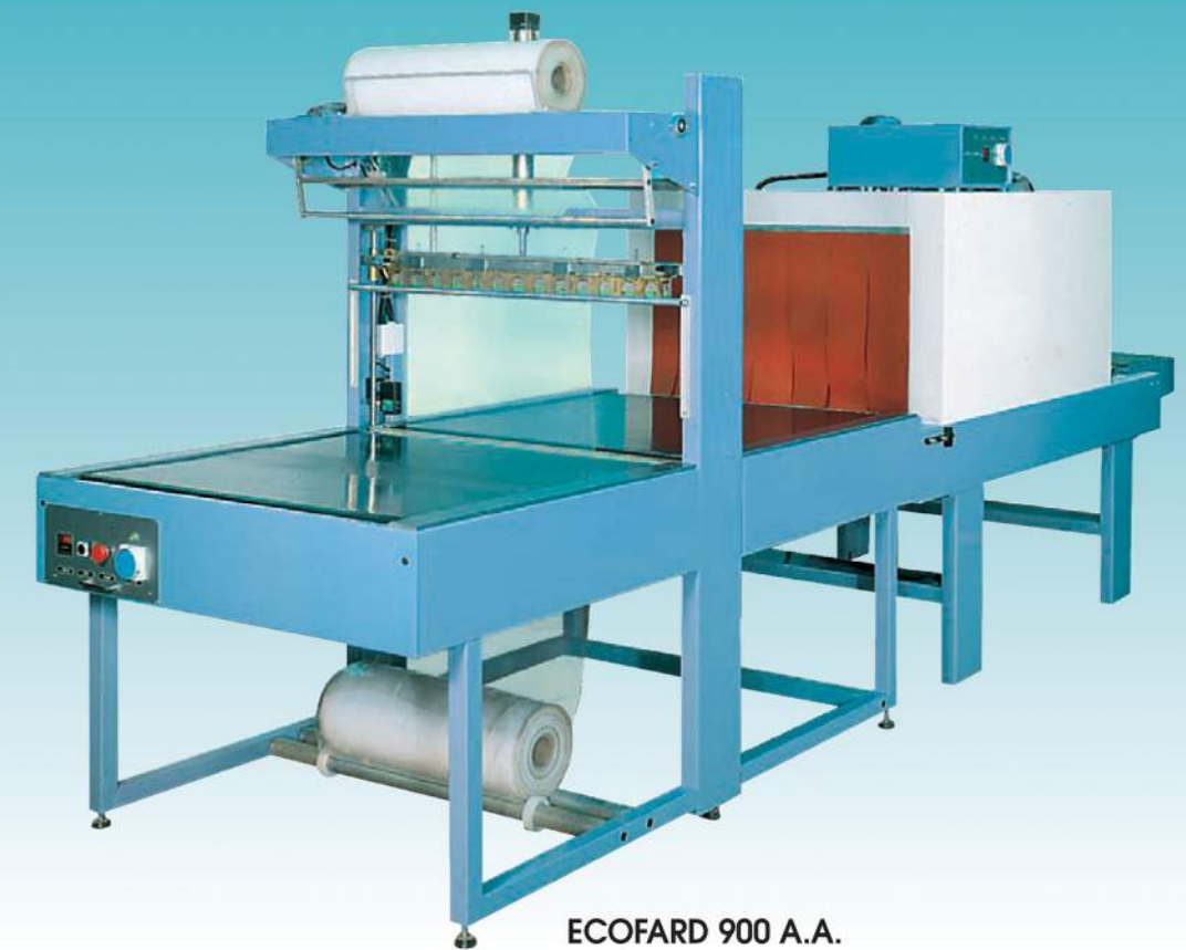
ECOFARD 900 A.A.

LA RISPOSTA PIÙ COMPLETA A OGNI PROBLEMA DI AFFARDELLAGGIO - THE RIGHT ANSWER TO EVERY PROBLEM IN SLEEVE PACKAGING